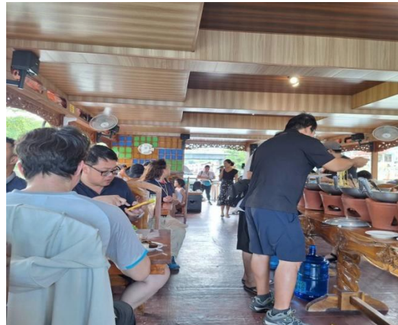
說明:薄荷島羅伯河 (Loboc River) 船上用餐