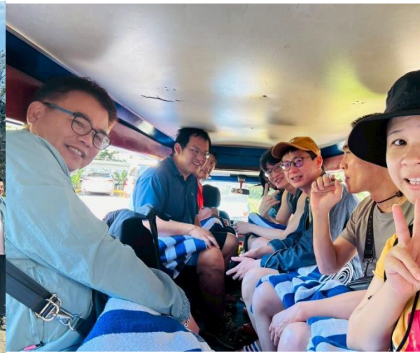
說明:以卡車為底盤改裝多用途交通工具