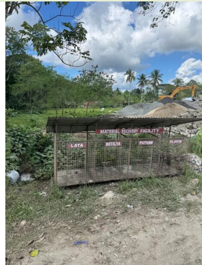
宿霧郊區回收哥桶