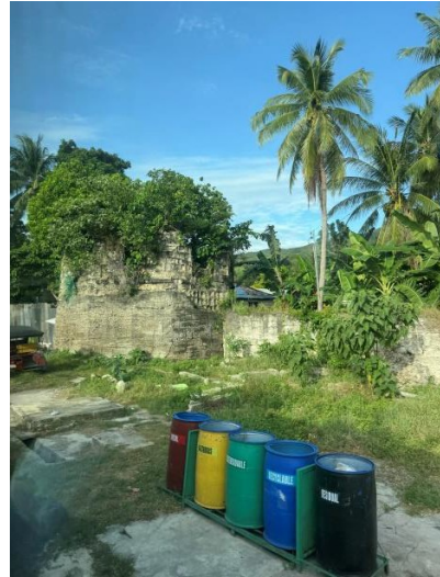
薄荷島地區回收垃圾桶