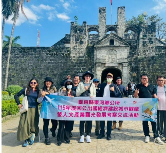
說明:西班牙殖民時期興建的聖彼得古堡