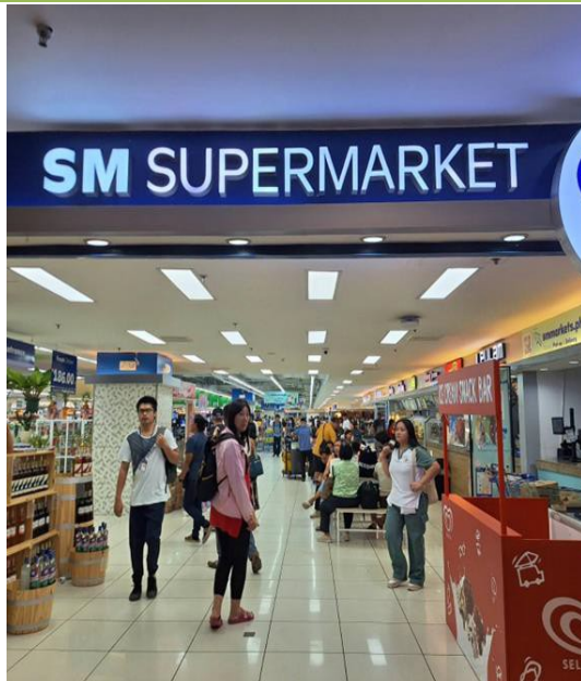
說明:最後一天逛 SM Supermarket 情形