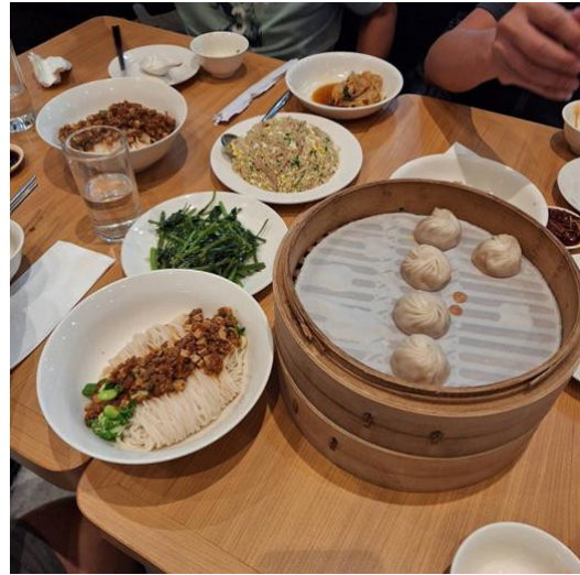
說明:宿霧鼎泰豐店之經典美食