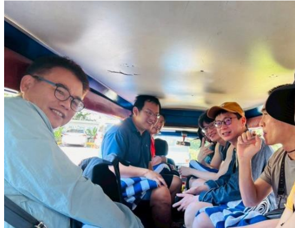
以卡車為底盤改裝多用途交通工具