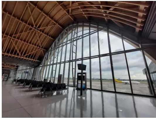
門戶設計的行銷力