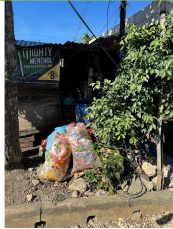
宿霧郊區垃圾處理