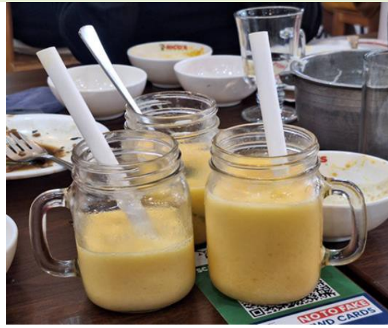
說明:菲律賓宿霧之芒果冰沙