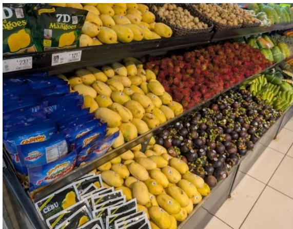
熱帶水果與農產價值提升

氣候炎熱的熱帶國家適合發展多樣化水果種植。色彩鮮豔的熱帶水果經由商家用心陳列與包裝，不僅提升賣相，也增加農民收益。從產地到貨架的整理與展示，是農業價值鏈提升的重要一環。