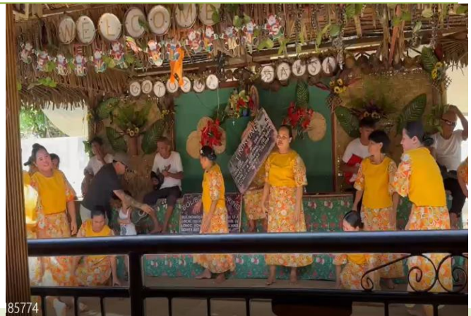
漂流河上的文化展演體驗

在鄉村地區，每所學校幾乎都有一座籃球場。籃球不只是運動設施，更是孩子向上發展的重要場域。從原野奔跑到團隊競技，籃球成為當地主要運動文化，也象徵著年輕世代透過體育被看見、翻轉人生的可能。