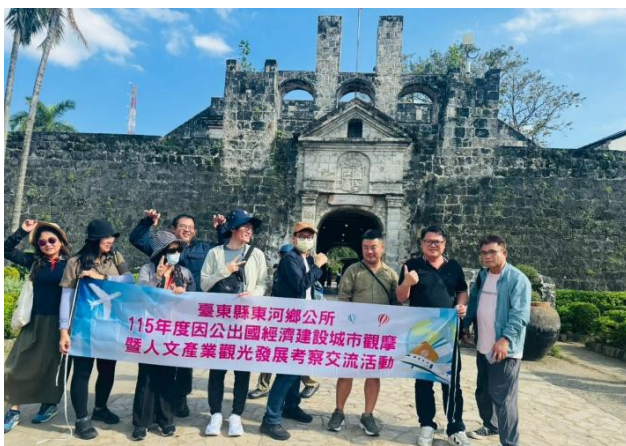
歷史文化建築（城堡、教堂）的保存與活化模式

在漂流河活動中融入在地舞蹈與音樂表演，讓遊客不只是參與水上活動，更能感受地方文化。這種「錯過就沒有」的現場演出，強化旅遊的獨特性與記憶點，也讓文化成為觀光的一部分。