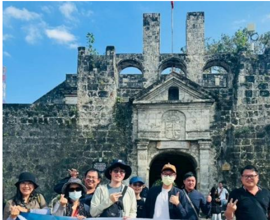
西班牙殖民時期興建的聖彼得古堡