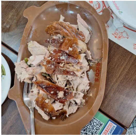
說明:宿霧被譽為全菲律賓最好吃 Lechon(烤乳豬) 所在地