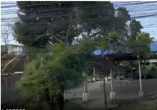
籃球場作為教育與流動的象徵

在鄉村地區，每所學校幾乎都有一座籃球場。籃球不只是運動設施，更是孩子向上發展的重要場域。從原野奔跑到團隊競技，籃球成為當地主要運動文化，也象徵著年輕世代透過體育被看見、翻轉人生的可能。