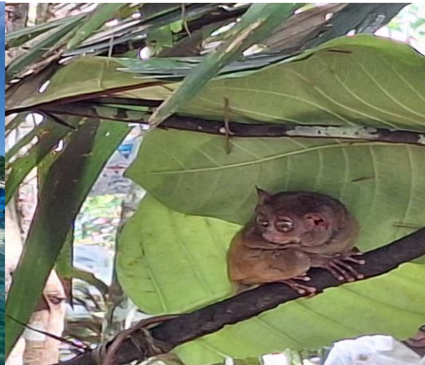
說明:眼鏡猴為保育類動物