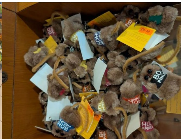
、特色物種帶動農村經濟

氣候炎熱的熱帶國家適合發展多樣化水果種植。色彩鮮豔的熱帶水果經由商家用心陳列與包裝，不僅提升賣相，也增加農民收益。從產地到貨架的整理與展示，是農業價值鏈提升的重要一環。