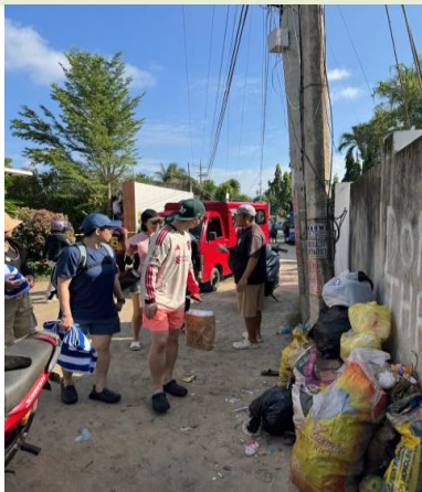
觀光地區垃圾處理情況