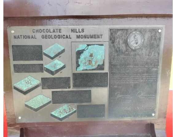
巧克力山構造形成介紹