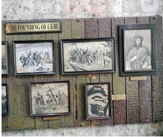
聖彼得古堡舊時景點照片