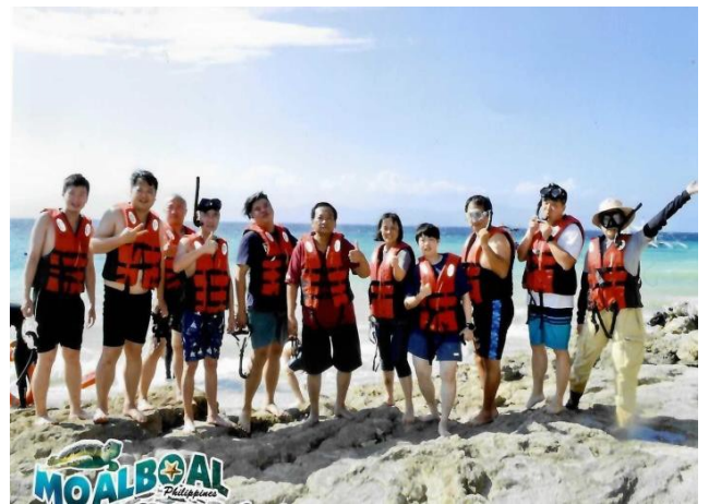
安全管理成就安心觀光

城堡式百年教堂在妥善保存下，透過觀光與經濟收益支撐維護經費，使歷史建築得以永續利用。兼顧文化資產保護與地方發展，是一種良性的循環模式。