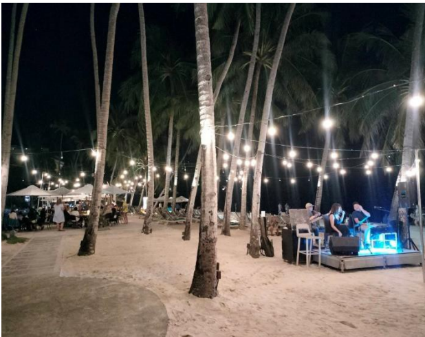
沙灘上之夜晚意象營造