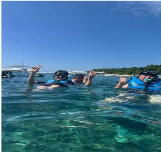
說明:菲律賓薄荷島搭螃蟹船海底浮潛體驗