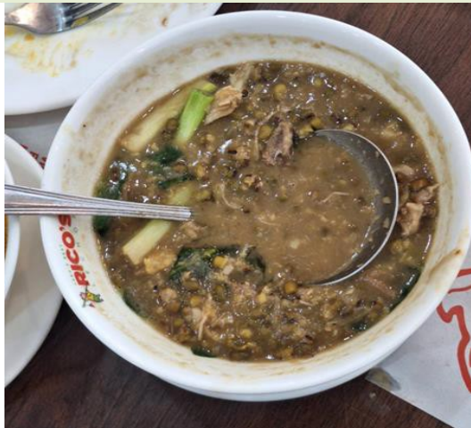
說明:菲律賓最著名料理