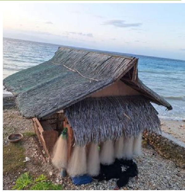
說明:菲律賓宿霧海邊搭設放置漁網等漁具的工寮