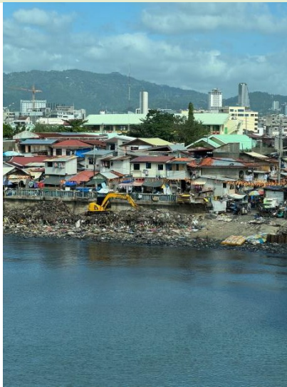
宿霧市區臨海環境