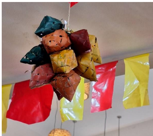
說明:竹籃飯為宿霧特有的「掛飯」(Hanging Rice)。用椰子葉編織成心形，在宿霧街頭隨處可見。